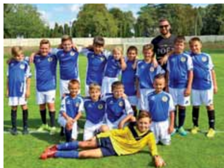
MLADŠÍ ŽIACI 2017/2018

vyššej okresnej súťaži a to hlavne vďaka podmienkam, či už technickým, tak aj vďaka veľkému počtu mládeže, o ktorú sa kompetentní v klube starajú.