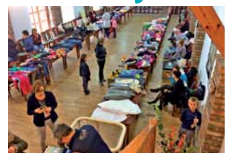
Členovia školskej a kultúrnej komisie

Nevzdávame sa nápadu a týmto dávame do pozornosti širokej verejnosti, že v jarných mesiacoch usporiadame druhé kolo burzy a nemusia to byť iba detské veci, možno niekomu pomôže aj niečo, čo vám zavadzí na povale, prekračujete ich v garáži, prípadne prekladáte v pivnici. Termín burzy bude vyhlásený v obecnom rozhlase a plagáty umiestnime na nástenku obce pred OU a na kultúrnom dome Orlovni, v OD Jednota, v MŠ a ZŠ.